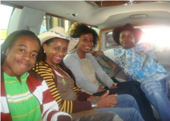
En limousine, avec la famille !